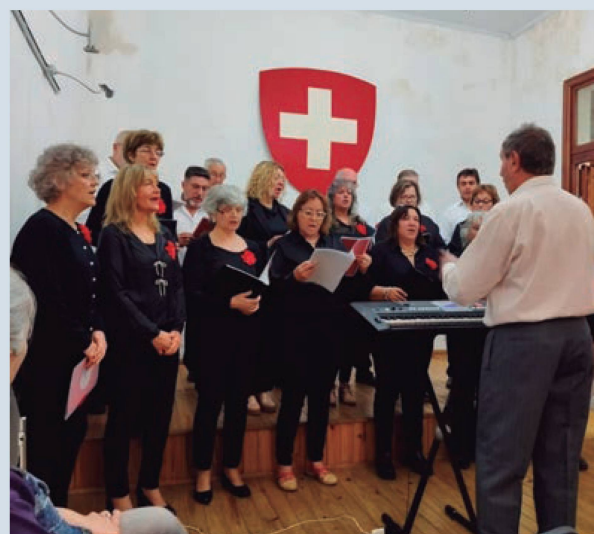
Coro Suizo-Festejo del 1º de agosto en la sede social

El entusiasta aplauso de los asistentes festejó y agradeció el concierto para luego compartir un brindis en el hall de la entidad cerrando este tradicional festejo helvético que se realiza en muchísimos sitios para celebrar la Fiesta Nacional de Suiza.