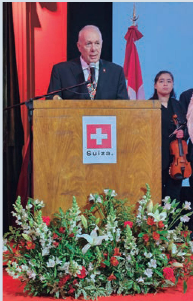
Embajador de Suiza Hans-Ruedi Bortis

Allí, el presidente de la CCSA destacó la importancia del concurso y la exitosa convocatoria, que en 2023 superó los 100 participantes.