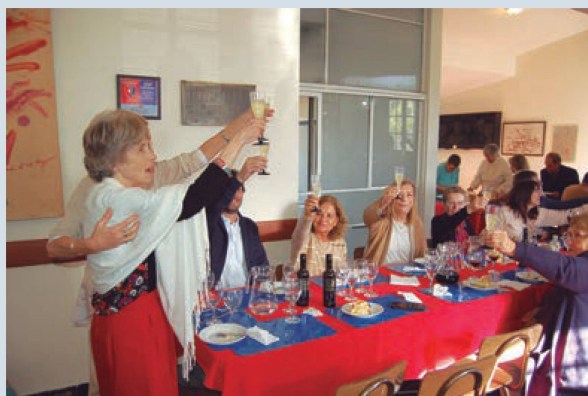
La Presidenta Nora Induni propone un brindis a la concurrencia