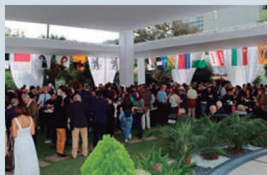
1° de agosto en la Residencia del Embajador

34 jóvenes suizos y suizas cumplieron o cumplirán la mayoría de edad este año en Perú. 16 aceptaron nuestra invitación y recibieron su certificado durante la Fiesta Nacional. Pudieron así conocerse y reunirse en una parte del jardín de la Residencia del Embajador creada especialmente para ellos.