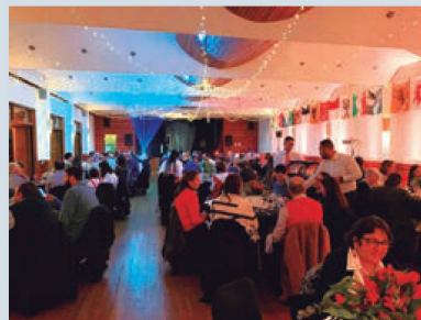
Salón Club Suizo de Santiago