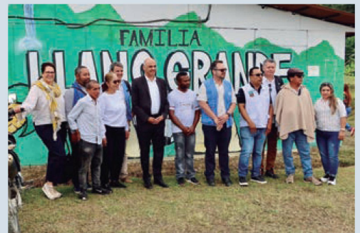
Presidente Alain Berset y Presidente de Colombia Gustavo Petro