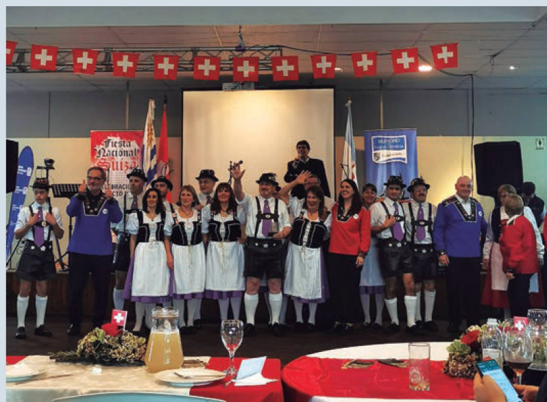
Grupo de danzas “Los alegres alpinos”