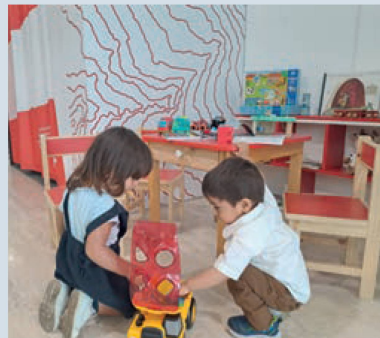
Zona de juegos en la Embajada de Suiza