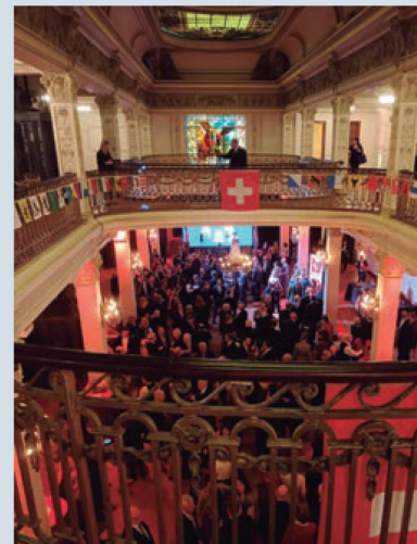
Palacio San Miguel

Previo al evento, ya se había realizado el anuncio de los premios y menciones y los ganadores fueron agasajados en la sede de la CCSA con la presencia de las autoridades de la organización y del Embajador Bortis.