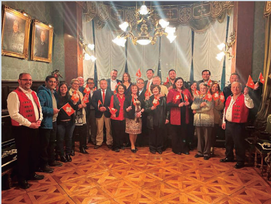
Festejo del 1° de agosto en Punta Arenas

enfrentar con éxito y entusiasmo nuestros nuevos e importantes desafíos” (A.P.R.).