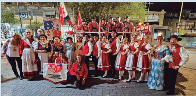
Orquesta Lustige Musikanten, Ballet Edelweiss, trajes típicos suizos