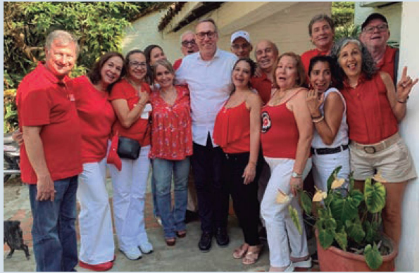
Celebración en Medellín La comunidad suiza en el evento celebrado en Cali