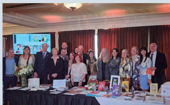
Muestra de Libros