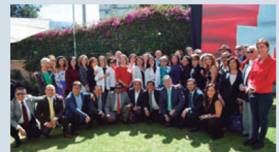
Colaboradoras/es y excolaboradoras/es de la Embajada y Cooperación Suiza en Bolivia.