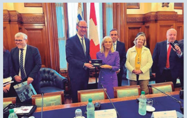
Visita a Uruguay del Presidente del Parlamento Suizo Martin Candinas, acompañado de una delegación parlamentaria