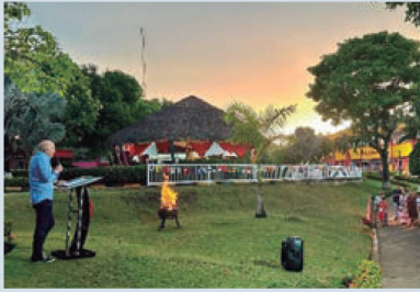
El Senador Josistch en la fiesta Nacional de Cartagena