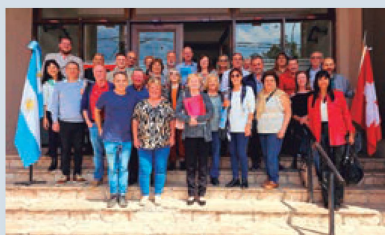
Reunión de F.A.S.R.A.