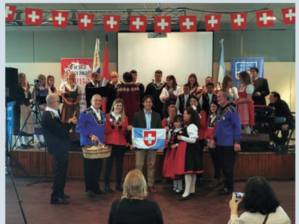
Presidente Luis Lacalle Pou e Integrantes de Comisión Pro Colonia Suiza Trabajo y Tradición