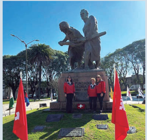
1° de agosto: Monumento a los fundadores- Integrantes Comisión Pro Colonia Suiza Trabajo y Tradición

(COMISIÓN PRO COLONIA SUIZA “TRABAJO Y TRADICIÓN”)