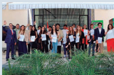
Jóvenes suizos en su mayoría de edad