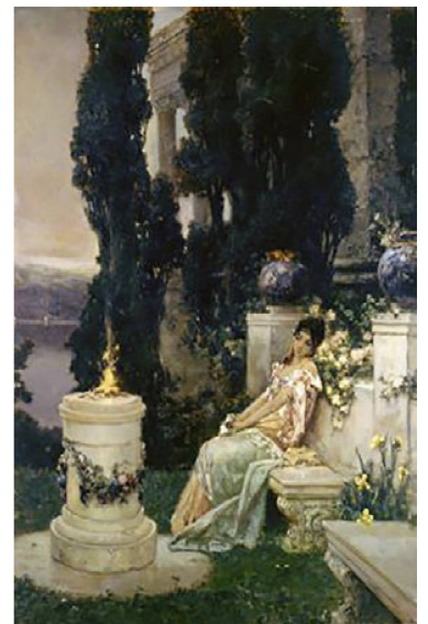
Wilhelm Kotarbinski. En el altar. Sin fecha. Óleo sobre lienzo.