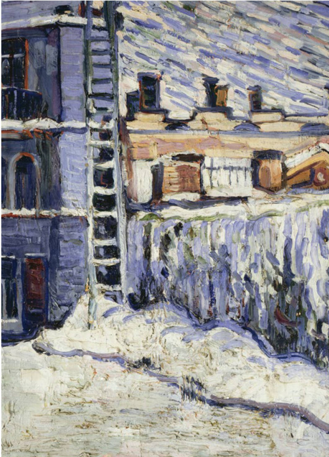
David Burliuk. Invierno en la ciudad. Sin fecha. Óleo sobre lienzo.