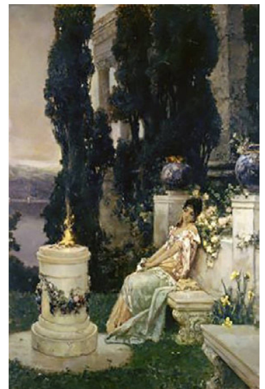
Wilhelm Kotarbinski. En el altar. Sin fecha. Óleo sobre lienzo.