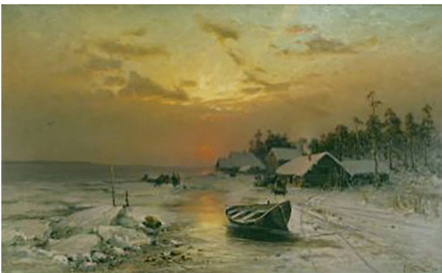
Yuliy Klever (Julius von Klever). Crepúsculo invernal. 1885. Óleo sobre lienzo.