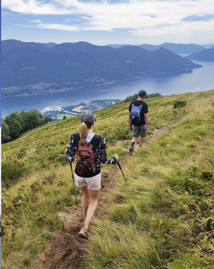
Lo que antaño era un destino invernal, ahora se está convirtiendo en un paraíso para amantes del senderismo. Casi todos los telesquíes de la "montaña del sol" se han desmontado.

Con Meteo Schweiz , la luz solar que ilumina la montaña por encima de Locarno adquiere un carácter científico. No en vano, aquí se realizan estadísticas y se evalúan los datos meteorológicos. Pero esto no es todo: en el jardín del instituto meteorológico se encuentra la Specola Solare Ticinese , un observatorio solar. Se fundó en 1957, el Año Geofísico Internacional; registra el número relativo de manchas solares ("número de Wolf") y hasta 1980 formó parte del Observatorio Astronómico Federal de la ETH de Zúrich. Desde entonces es operado por una asociación privada y suministra datos al Real Observatorio de Bélgica, organismo encargado actualmente de publicar el número relativo de manchas solares. Como dato curioso cabe señalar que los mapas de manchas solares se siguen dibujando a mano.