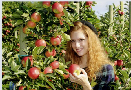
Las 245 profesiones para las que se ofrecen un aprendizaje en Suiza presentan una enorme variedad: desde fruticultora o fruticultor...

Para mayor información y para presentar una solicitud de beca, favor de dirigirse a educationsuisse , Formación en Suiza, Alpenstrasse 26, 3006 Berna, Suiza Tel. +41 31 356 61 04 info@educationsuisse.ch