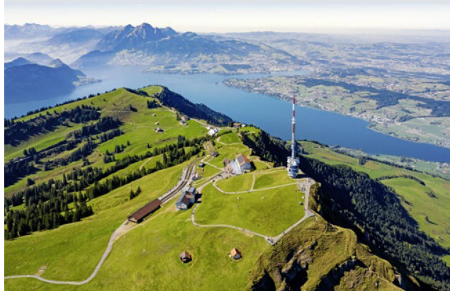
Foto aérea del Rigi con vistas al lago de los Cuatro Cantones, al monte Pilato y a la meseta de Lucerna.

ción activa de más de sesenta jóvenes suizos del extranjero que se unirán a nosotros procedentes de los campamentos de verano, y estará marcado por la presencia de un miembro del Gobierno suizo y la participación del mundo empresarial y la comunidad