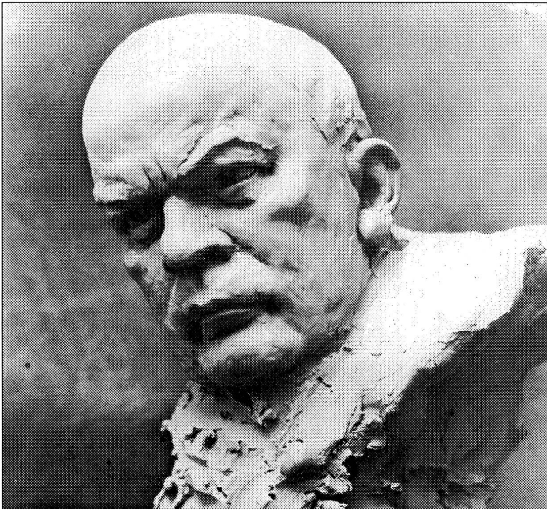
Un des bustes de Léon Nicole réalisé par le sculpteur Pedro Meylan.