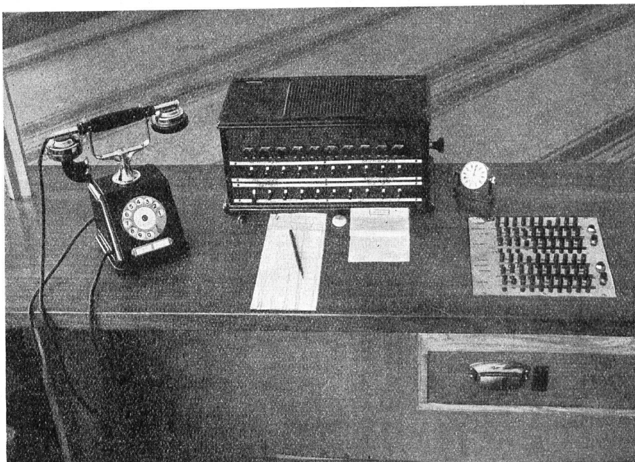
Fig. 1. Gebereinrichtung.

Es ist klar, dass eine solche vorübergehende Netzerweiterung in der gleichen geographischen Richtung und auf einem verhältnismässig kleinen Raume sich nicht immer gut ausführen lässt. Doch gestattete die Lage des Ausstellungsareals die Benützung von zwei günstig gelegenen 40er-Verteilkasten und eines durch Umschaltung teilweise frei gewordenen Kabelstranges mit rund 60 Adernpaaren, so dass alle Anschlüsse direkt an die automatische Zentrale Bolkwerk geführt werden konnten.