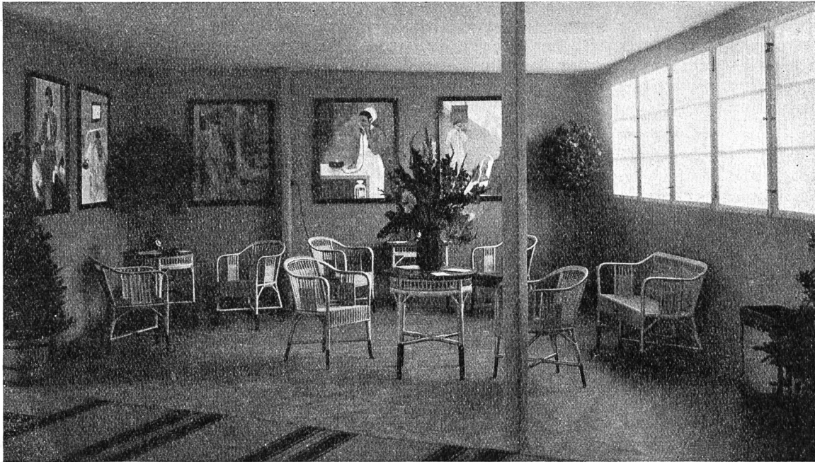
Fig. 3. Warteraum.

Die Leuchttafel besitzt vier Lichtfelder; zwei Lichtfelder mit einmontierten Zahlensignalschaltwerken werden zum Signalisieren der zweistelligen Nummern benutzt. Ein Lichtfeld dient zur bildlichen Darstellung einer Telephonkabine und ein Lichtfeld, ebenfalls mit einmontiertem Zahlensignalschaltwerk, gibt die Kabinennummer an.