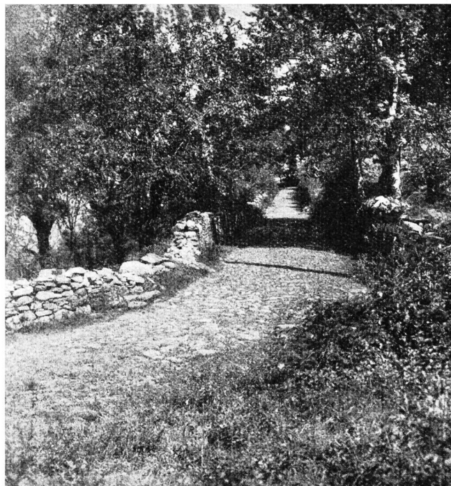
Fig. 2. La vecchia strada romana Quartino-Ceneri.

Imperatori, vescovi, nobili e cavalieri non mancarono di vedere in me un punto strategico importante, e per conseguenza, di lottare per avermi. E i Sacco e i Della Torre, e i Canonici del Duomo di Milano, non meno che Federico II, il quale, geloso della conquista di tutti i passi delle Alpi centrali, compresa la parte settentrionale del Gottardo e del Lucomagno, ripone in me il perno della difesa verso la minaccia degli Orello, da Bellinzona. Ricordo che in quel tempo le nostre terre erano governate da guelfi o da ghibellini, a seconda che a Milano ed a Como prevaleva l'uno o l'altro partito. La bella valle del Sole è retta nel 1270 dai guelfi Della Torre, signori anche di Como, i quali, alla Tresa, riescirono a catturare quel prode capitano, di nome Simone d'Orello, coi suoi due nipoti Rumecio e Guidotto. Ma il 20 gennaio 1277 i ghibellini Simone di Bullo e Ottone Visconti, arcivescovo di Milano, vincono e fanno prigionieri i Della Torre, formano la dinastia viscontea, e signoreggiano sino alla conquista degli Svizzeri nel 1402—1512. — Il mio nome girava