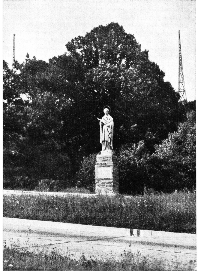
Fig. 4. La statua di S. Carlo Borromeo, al Monte Ceneri.

Negli anni che precedettero il 1880 le mie viscere ebbero un fremito. Che cosa state facendo o uomini irrequieti? Stanchi di calpestarvi, volete ora trafiggermi il cuore? Ma eccomi in pochi anni forato da