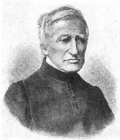
Fig. 1. Pater Athanasius Tschopp

nisse boten. Auch Pater Athanas beschäftigte sich eingehend mit diesem ebenso interessanten als für die Zukunft so viel verheissenden Gedanken. Gegen Ende der vierziger Jahre erfand er einen electromagnetischen Copir-Telegraphen, den er selbst „Typotelegraph“ nannte. Die in Fig. 2 und 3 abgebildeten Modelle wurden durch Mechaniker Meinrad Theiler von Einsiedeln ausgeführt. Fig. 2 stellt den Zeichengeber, Fig. 3 den Zeichenempfänger dar. Beide Apparate haben folgende Haupttheile gleich: