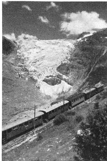
Abb. 1. Furkabahn mit Rhonegletscher. Nr. 1217 BRB 3. 10. 1939.

Die Bahn wird mit Einphasenstrom 11 000 V, 16\frac{2}{3} Perioden betrieben. Das Holz ist hier wieder zu Ehren gezogen worden; als Stützpunkte für den Fahrdrabt dienen nämlich Holzstangen. Sie haben sich im Gebirge seit langem bewährt, und dies ist ein wahres Glück, denn in den heutigen Zeiten wäre die Beschaffung von Eisenmasten auf grösste Schwierigkeiten gestossen. Die Gestänge werden sich ganz gut in die Landschaft einfügen, wenn sie einmal nicht mehr so neu aussehen werden.