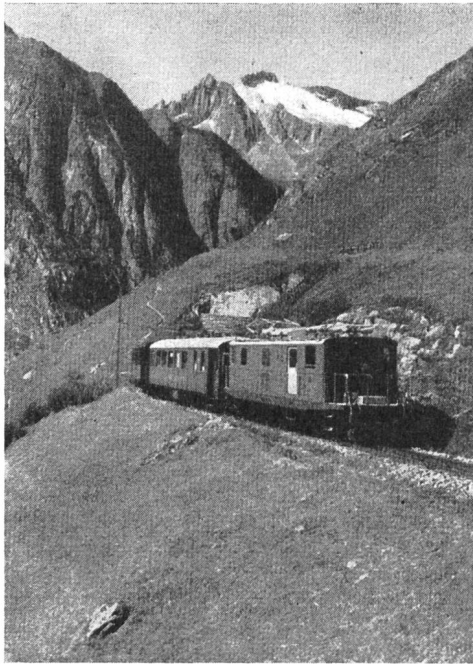
Abb. 2. An der Oberalp. Nr. 1498 BRB 3. 10. 1939.

Für den Betrieb der Furka-Oberalp-Bahn und der Schöllenenbahn sind folgende drei Fahrzeugtypen vorgesehen: