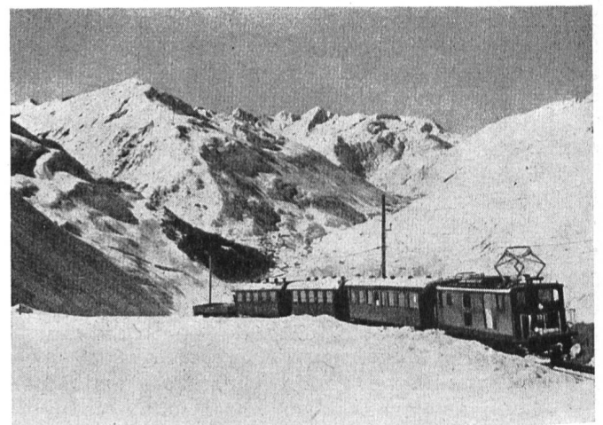
Abb. 3. Wintersportzug der Furka-Oberalp-Bahn.

Die Elektrifikation der Furka-Oberalp-Bahn ist in schweren Zeiten durchgeführt worden, und die kühnen Baumeister haben viele Hindernisse überwinden müssen, bevor sie ihr Werk zu einem guten Ende führen konnten. Heute, wo es vollendet dasteht, erwarten sie einen starken Zustrom von Reise- und Feriengästen. Es wäre zu wünschen, dass ihre Erwartungen in Erfüllung gingen, denn das Betriebsmittel ist nun ideal ausgebaut und die vielen Naturschönheiten der Gegend haben von ihrer alten Anziehungskraft nichts eingebüsst. Wir möchten nur