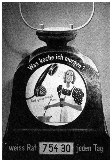
Abb. 2. Schaufenster-Reklame für Lebensmittelgeschäfte (Entwurf Gaswerk).

Sobald die Maschine I die 4—6 Minuten dauernde Sendung beendet hat, schaltet sich Maschine II ein und übernimmt die Sendung. Unterdessen wird der Stahldraht der ersten Maschine automatisch mit dreifacher Geschwindigkeit in die Anfangsstellung zurückgespult. Der erste Anruf setzt die Anlage in Betrieb; mit dem Aufheben der letzten Verbindung wird sie abgeschaltet. Damit das gesprochene Menu sofort mit voller Lautstärke vernehmbar ist, sind die Verstärker während der Betriebszeit dauernd eingeschaltet.