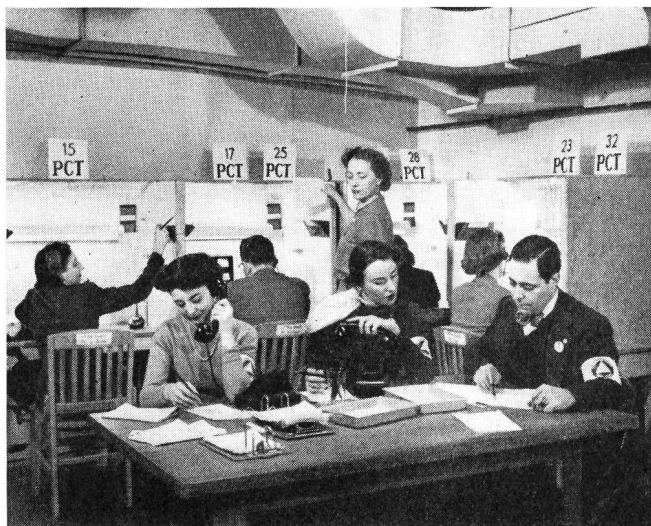
Fig. 1. Meldesammelstelle der amerikanischen Zivilverteidigungsorganisation Centre de renseignements de l'organisation américaine de défense civile

Anhand der offiziellen «Bell System Statistics» erhält man eine gute Übersicht über die gewaltige Entwicklung und den heutigen Stand der Telephonie in den Vereinigten Staaten. Zu Vergleichszwecken