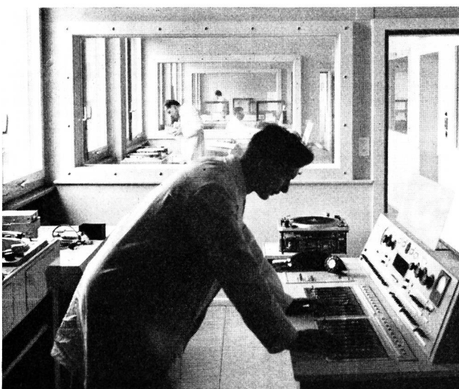
Fig. 2. Blick in die Senderäume des Kurzwellendienstes während der Montagearbeiten

Das Gebäude beherbergt im Erdgeschoss die technischen Anlagen und die Studios des Schweizerischen Kurzwellendienstes, während im ersten, zweiten und zum Teil im dritten Obergeschoss die vielsprachigen Programmzweige und die Direktion des KWD