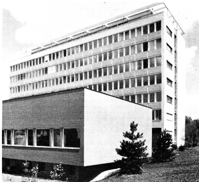
Fig. 1. Der Neubau der SRG an der Giacomettistrasse in Bern. Im Vordergrund der Anbau für den Kurzwellendienst

untergebracht sind. Ebenfalls im ersten Stock befinden sich die Räume der Programmleitung des Telephonrundspruchs sowie dessen künftiges Schaltzentrum. Das vierte bis sechste Obergeschoss wird von der Generaldirektion der SRG beansprucht. Im sechsten Stock liegen ferner zwei grosse Konferenzräume für die Sitzungen des Zentralvorstandes der SRG und die Direktorenkonferenzen der Landessender. Im Dachgeschoss, mit herrlicher Aussicht auf die Berner Alpen und die Stadt, ist der Erfrischungsraum für das Personal und die Wohnung des Abwartes untergebracht.