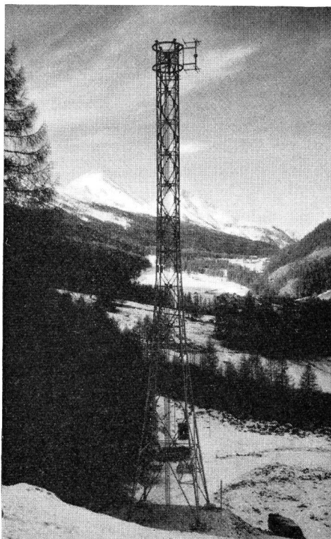
UKW-Sender Sta Maria i.M. mit Blick talaufwärts gegen den Ofenpass. Im Hintergrund der Piz d'Aint (links) und der Piz Plavna dedaint

Die beiden 6-Watt-FM-UKW-Sender sind in einem kleinen, aus Betonplatten gefertigten, etwas oberhalb des Dorfes Santa Maria an der Umbrailstrasse gelegenen Häuschen untergebracht. Ein 30 m hoher Antennenmast trägt die beiden Yagi-Antennen,