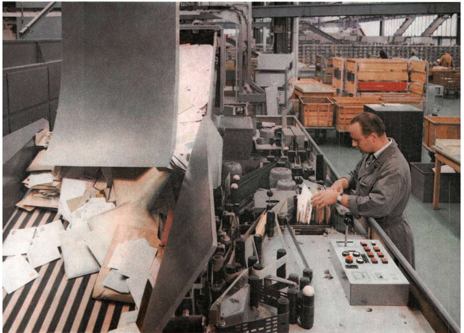
Die mechanische Briefbearbeitung in der Schanzenpost Bern Le tri mécanique des lettres à la Schanzenpost Berne