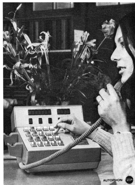
Fig. 4 Kontrollstation – Poste de contrôle