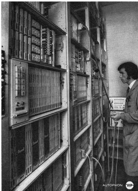
Fig. 3 Teilansicht der Weckeinrichtung – Vue partielle de l'installation de réveil automatique

Les ordres isolés et en abonnement sont exécutés de manière entièrement automatique, dans les limites de la capacité