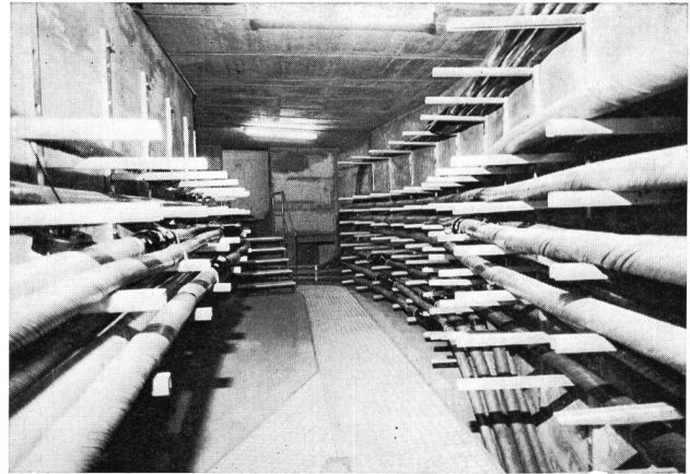
Fig. 2 Berns unbekanntes Unterwelt: Blick in einen der Kabelstollen mit grossen und kleineren Orts-, Bezirks- und Fernkabeln

und Schwarzenburg, Niederscherli, Grosshöchstetten, Thörishaus und Neuenegg, ferner Bern/Bollwerk-Belp, Burgdorf-Sumiswald und Langnau-Signau.