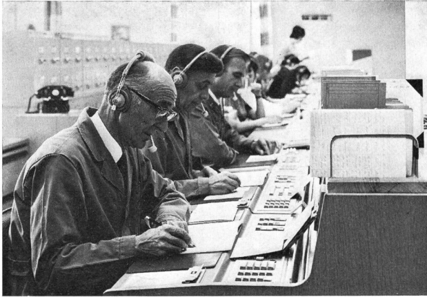
Fig. 1 Messplätze des neuen Störungsdienstamtes Bern