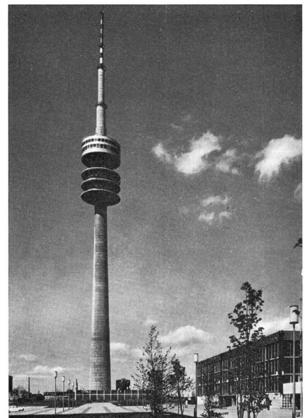
Fig. 3 Olympiaturm in München – Beispiel eines richtstrahltechnischen Zentrums für Fernsehprogramm- und Radioprogrammaustausch und Vielfachtelefonie nach Nord und Süd, Ost und West

Während der Olympischen Spiele in München werden für die Live-Fernsehberichterstattung von Wettbewerben, an deren Austragungsort keine direkte Anschlussmöglichkeit an das TV-Übertragungsnetz besteht, kurzfristig und nur vorübergehend Richtfunk-Zubringerverbindungen benötigt. Für den Aufbau derartiger Verbindungen entwickelte Siemens die mobile Richtfunkeinrichtung FM TV/13 000, mit der der Radiofrequenzbereich um 13 GHz erschlossen wird. Das Fernmelde-technische Zentralamt der Deutschen Bundespost hat für die Spiele 30 entsprechend ausgestattete Spezialfahrzeuge mit der