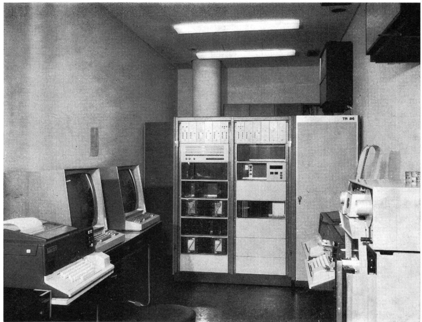
Fig. 1 Prozessrechner TR 86 von AEG-Telefunken mit (rechts) Lochstreifenleser und -stanzer sowie (links) Blattschreiber und Datensichtgeräten. Der hinter dem Rechner aufgestellte Plattenspeicher hat eine Kapazität von 16 Mio Bit

Der Prozessrechner, der in der neuen Betriebszentrale des NDR aufgestellt ist, wird zurzeit im Testbetrieb erprobt. Er wird Mitte 1972 die Programmabwicklung übernehmen. Zu diesem Zweck wird mit Hilfe einer Schreibmaschine ein Lochstreifen für den täglichen Programmablauf angefertigt und sodann dem Rechner in seine Programmspeicherung eingelesen. Danach ist er in der Lage, zu den gewünschten Zeiten die Ton- und Bildquellen einzuschalten und den Programmablauf zu übernehmen. Er startet die Film- und Magnetbandmaschinen, sucht sich die gewünschten Diapositive aus den Magazinen aus, schaltet Mikrophone und Kameras sowie die Beleuchtung in den Ansagestudios ein und auch wieder aus, und er sucht bei einer Bild- oder Tonstörung das hierfür notwen-