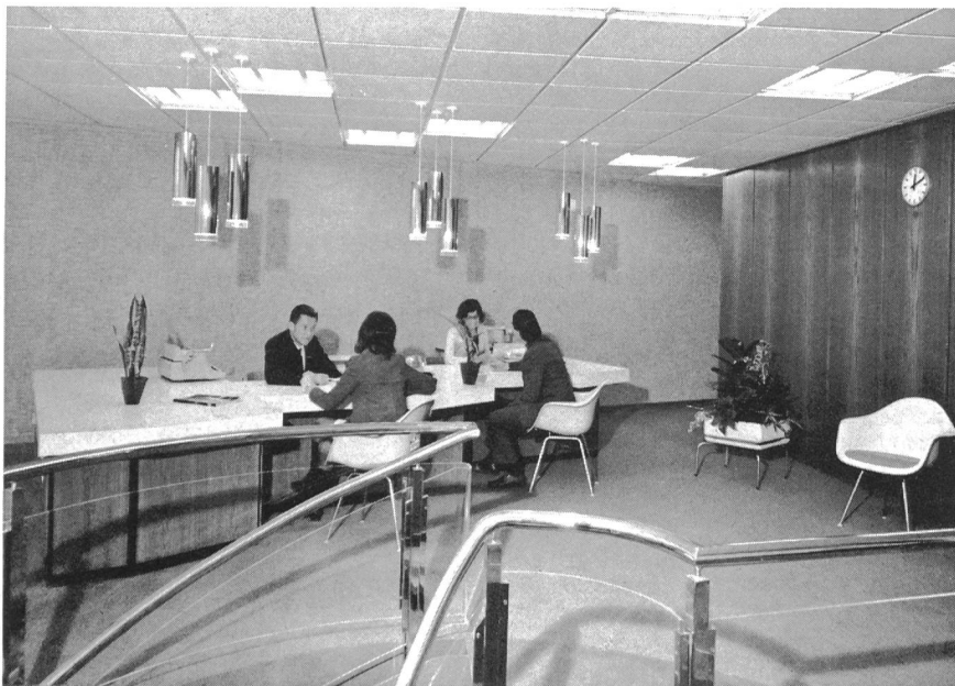
Fig. 1 Un cadre plaisant, un personnel stylé, accueillent le client et facilitent le contact