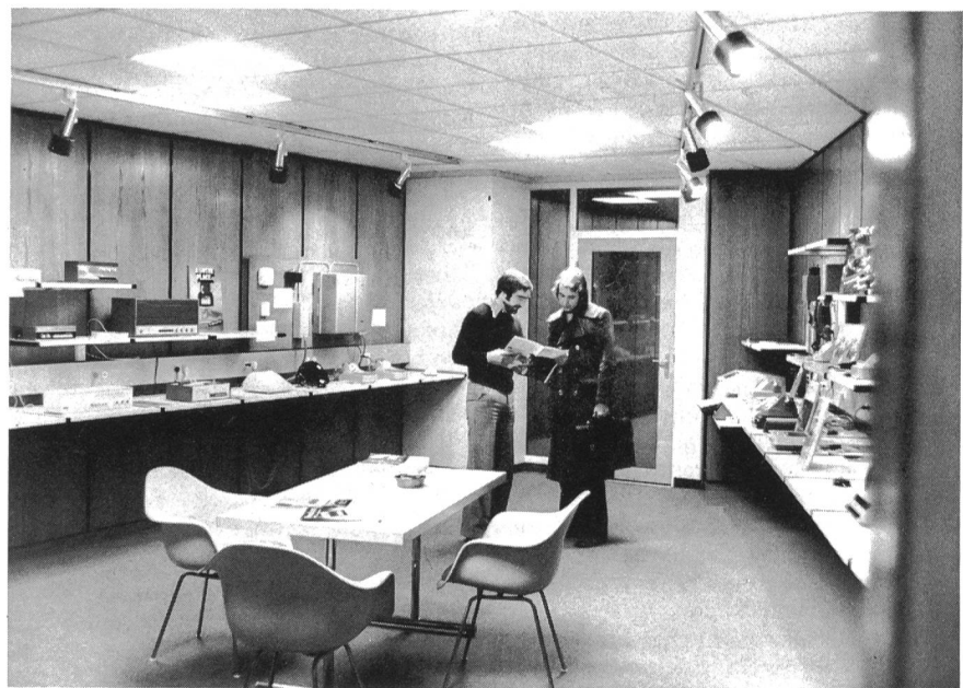
Fig. 2 Les installations en service permettent des démonstrations selon les besoins de l'utilisateur