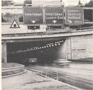
① Strassenverkehrstechnik Technique de commande du trafic routier par feux lumineux