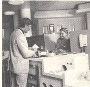
② Fördertechnik Convoyeurs pour documents et objets divers