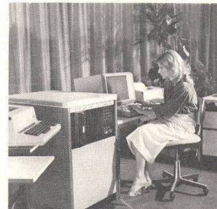
⑦ Hausfernsehzentrale ALBIS EMX 1010 Central téléx d'abonné ALBIS-EMX 1010

Ich interessiere mich für folgende Teilgebiete: (Zutreffendes ankreuzen)