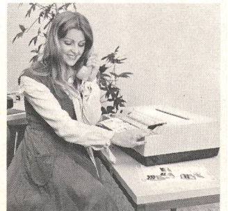
⑧ Fernkopieren Appareils de communication

Senden Sie mir detaillierte Unterlagen ① ② ③ ④ ⑤ Faites-moi parvenir une documentation détaillée ⑥ ⑦ ⑧ ⑨ ⑩