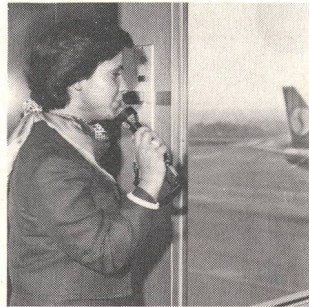
③ Tontechnik Sonorisation