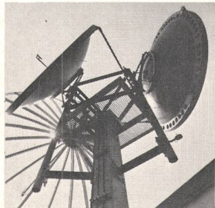
⑥ Antennentechnik Antennes