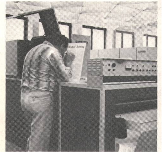
④ Digiset Lichtsatanlagen Photo composeuses Digiset