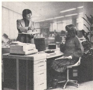
⑩ Datenverarbeitung Informatique