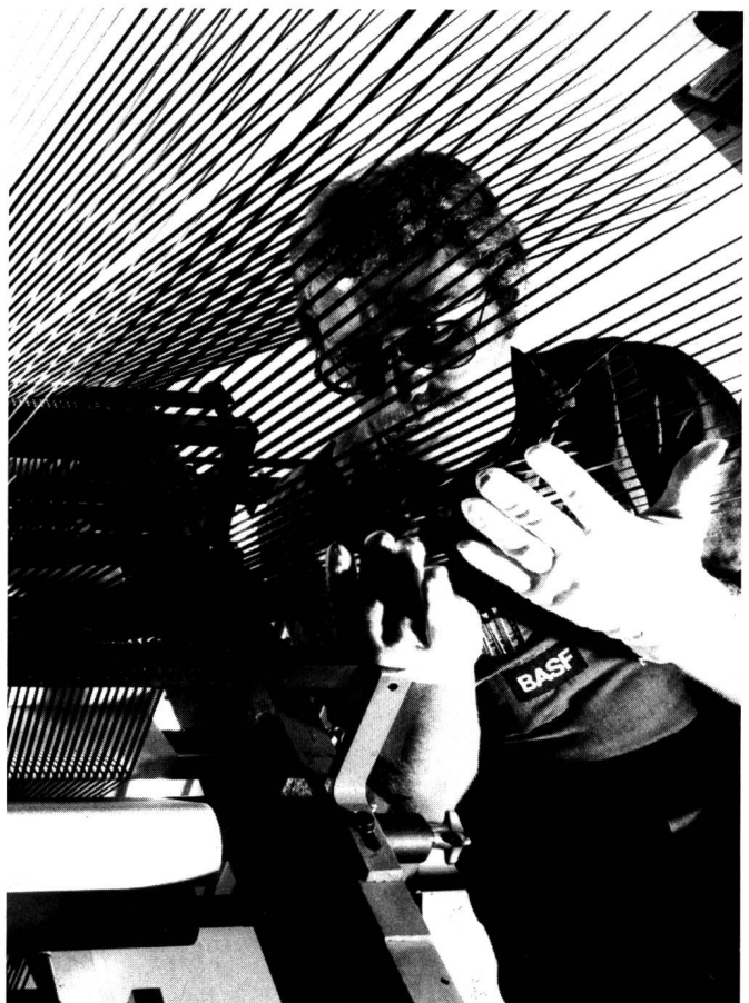
Diese Präzisionsmaschinen schneiden Folien in Magnetbänder – Ces machines de précision coupent les feuilles en bandes magnétiques

Die dichte Packung feiner Partikel zur Erzeugung rauscharmer Schichten mit hohem magnetischem Moment, Homogenität und glatter Oberfläche zur Vermeidung von Modulation sind Forderungen, die das Interesse an Metallpigmenten und Metalldünnschichten verständlich machen.