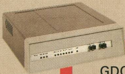
GDC Data Comm Modem