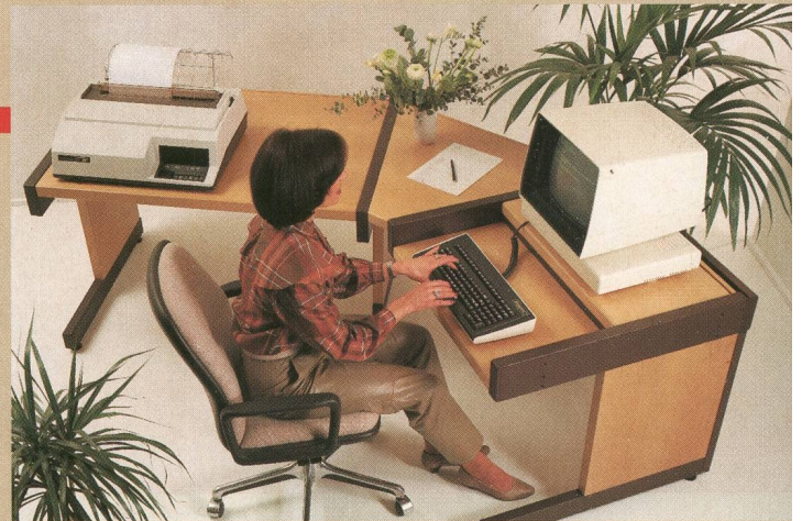
Arbeitsplatz Comatek 2003 für «effiziente Meldungsbearbeitung»