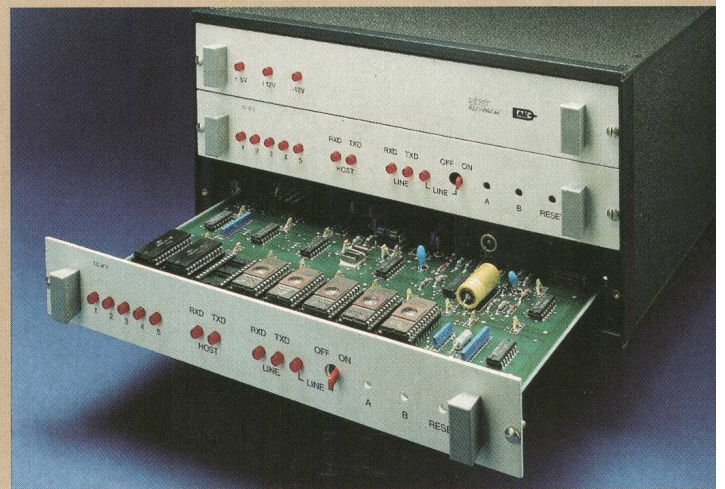
Mikrocomputer-Telecom-IF Serie 3 und Serie 4