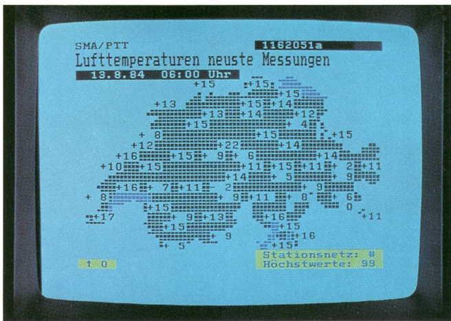
Lufttemperaturen. Die Wetterprognose der Schweizerischen Meteorologischen Anstalt, mit Lufttemperaturen oder Flugwetter wird zweimal täglich nachgeführt und kann jederzeit abgefragt werden. Température de l'air. Les prévisions du temps de l'Institut suisse de météorologie, comprenant la température de l'air et des informations pour la navigation aérienne, sont publiées deux fois par jour et peuvent être consultées en tout temps.

scher und preislicher Hinsicht vollumfänglich genügen zu können.