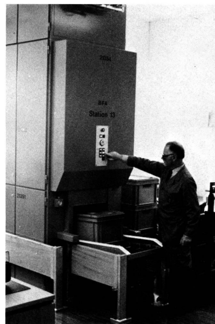
Fig. 3 Eingabestation – Poste d'admission des récipients

Un plan incliné à rouleaux amène par simple gravité les récipients en position d'attente devant les élévateurs verticaux (ascenseurs ou convoyeurs d'étage). L'entrée du lieu de destination au clavier fait démarrer le processus automatique d'admission et les récipients sont transférés dans la position correcte sur l'élévateur vertical (fig. 3). Des dispositifs de sécurité appropriés permettent de neutraliser toute source de perturbations d'ordre technique ou opérationnel, de localiser, le cas échéant, des dérangements et contribuent à prévenir efficacement tant des dommages à l'installation que des accidents pour les personnes. Après le parcours vertical, le récipient est transféré sur le tronçon de transport horizontal. Le récipient arrive à l'élévateur central sans fin (paternoster) en position d'attente à l'intérieur du dispositif d'admission. A l'approche d'un bras de suspension libre sur la chaîne sans fin, le chariot d'entrée se met en position de transfert et le récipient est emporté par le bras de suspension. Simultanément, l'information relative à la destination du récipient est extraite de la mémoire du processeur et transféré au porteur d'adresse du bras de suspension.