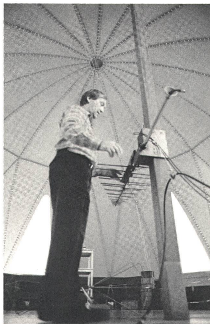
... bei der Aufnahme der Eigenschaften einer Antenne ... ... lors du relevé des caractéristiques d'une antenne...

Es drängt sich der Vergleich zwischen den USA und der Schweiz auf. Um es gleich vorwegzunehmen: Besser