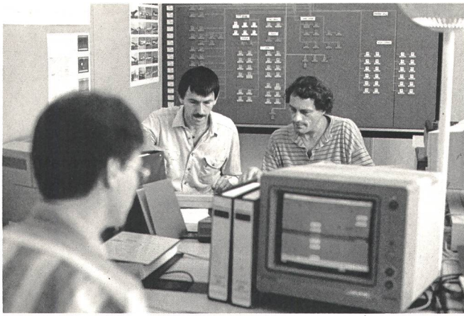
... bei den Abnahmemessungen einer modernen Telefonzentrale ... ... l'occasion des mesures de réception d'un central téléphonique moderne...