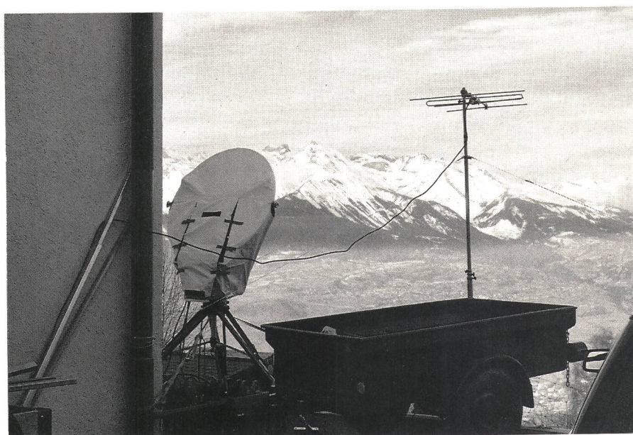
Terminal d'une liaison de secours à faisceaux hertziens entre Sion et Nendaz