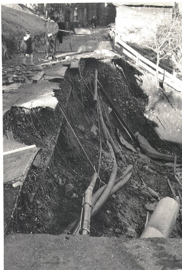
Câbles téléphoniques emportés par un glissement de terrain à Basse-Nendaz

La mise en place dans des délais très brefs de liaisons provisoires par la Direction des télécommunications de Sion, à l'instar de ce qui s'est fait dans toutes les régions sinistrées, a permis d'assurer l'organisation des secours avec un maximum d'efficacité.