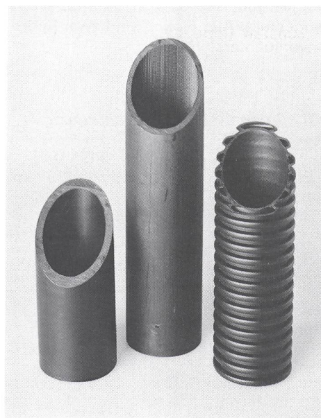
Fig. 1 Kabelschutzrohre aus PE-Regranulat

Die Kompaktrohre entsprechen den im Pflichtenheft für Kunststoffrohre angegebenen Abmessungen, bei den Profilrohren handelt es sich um eine aus dem KWF-Projekt «Rohr» hervorgegangene Entwicklung (Fig. 1).