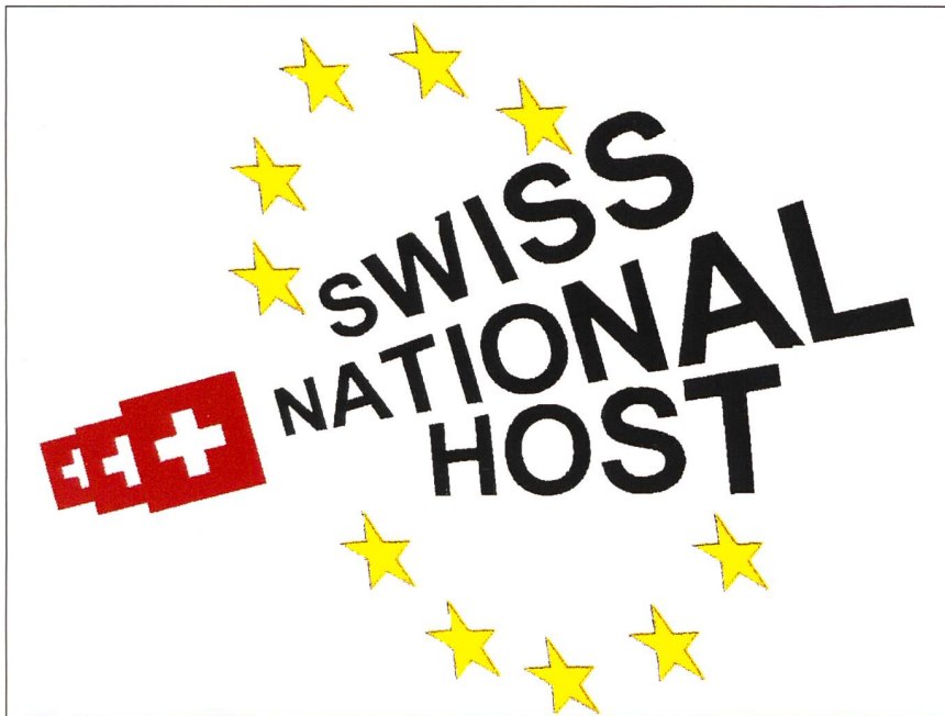
Bild 1. Logo des Swiss National Host.

ler Weise für die Beherbergung von Gastprojekten auf dem Gebiet der Breitbandtelekommunikation.