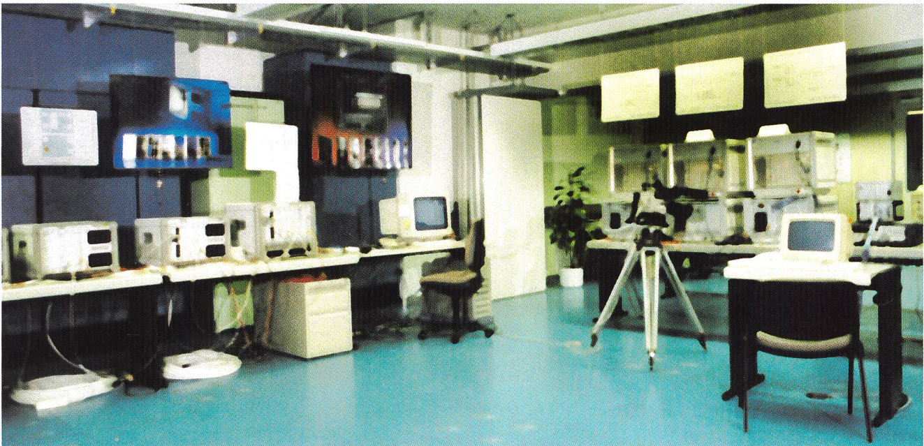
Bild 5. Blick in eine typische Laborumgebung am Swiss National Host.

ten National-Host-Tage vom 6. bis 10. November 1995 in Wien gewesen sein. Diese Konferenz selbst setzte sich aus einer Vielzahl von Ereignissen zusammen wie