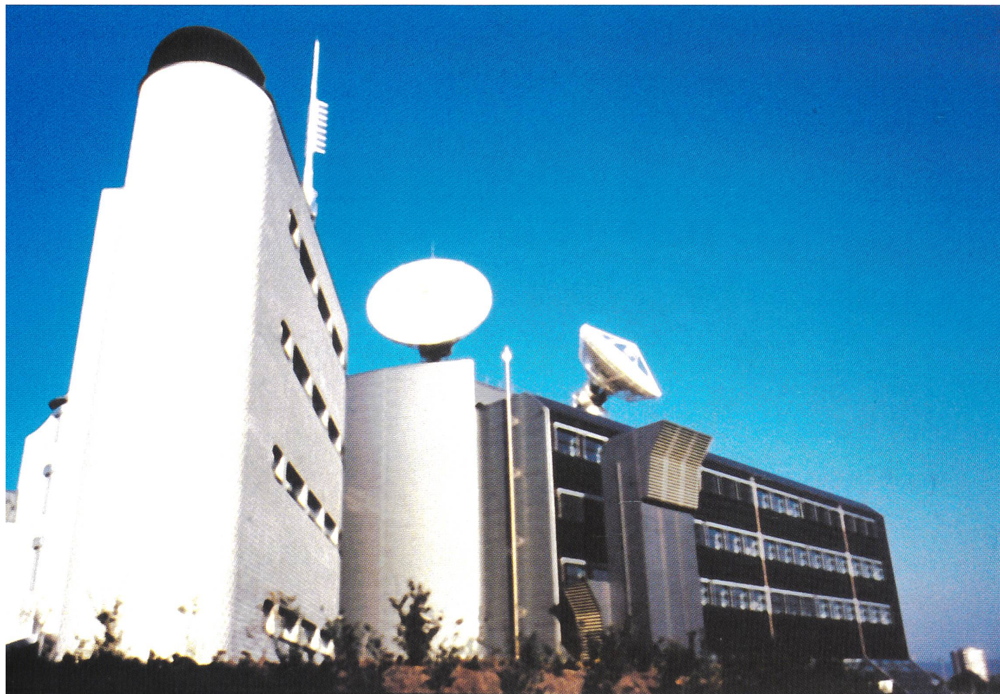
Bild 2. Das Fernzentrum Grosspeter in Basel, welches im dritten Obergeschoss unter anderem auch den Swiss National Host beherbergt.

Bereich, hauptsächlich für die Betreuung der Gastgruppen, durch ein Sekretariat wahrgenommen.