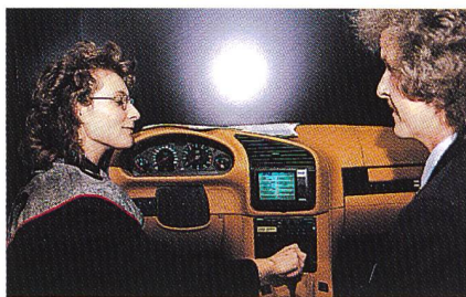
Bild 2. Digital Audio Broadcasting (DAB), der digitale Rundfunk für den Radioempfang in perfekter Tonqualität, wurde den Kundinnen und Kunden in einem eigens für die Ausstellungen hergerichteten Autocockpit vorgestellt.

easy, die Chipkarte mit vorausbezahlten Gesprächsgebühren für den vereinfachten Einstieg in die Mobiltelefonie, und Telepage business, ein effizienter Pagingdienst, der auf dem europäischen Standard ERMES (European Radio Message System) basiert. Auch das «blue window», der Zugang zum Internet, fand viele Interessentinnen und Interessenten. Zeitgleich mit der Orbit startete die Telecom PTT zusammen mit Radio Basilisk auch ihr Basler Pilotprojekt mit Digital Audio Broadcasting (DAB), dem digitalen Rundfunk für den mobilen und stationären Radioempfang in perfekter Tonqualität.