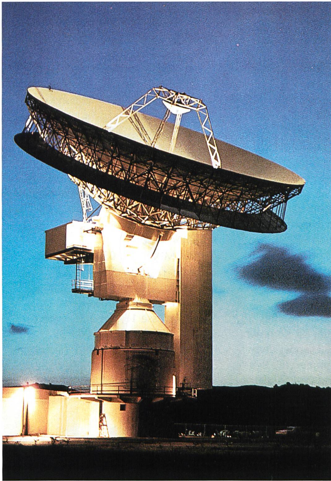
Bild 2. Bodenstation Cayey in Puerto Rico.

ben mit dem Transport von Satelliten nicht nur der Fernseh- und Radioübertragung eine neue Dimension verliehen, sondern auch der Telefonie. Mit neuen Technologien, wie das von Bertrand Piccard im «Breitling 3» verwendete «IN-MARSAT», «IRIDIUM» wird die drahtlose Übertragung von Gesprächen auch dort möglich, wo keine lokale Infrastruktur vorhanden ist. Das sind weitere Meilensteine im Siegeszug des Handy. Die Ausstellung zeigt die Entwicklungslinien der weltweiten Datenübertragung via Satellit und lädt das Publikum ein, über die Folgen nachzudenken: die verwirrende audiovisuelle Flut, die über uns hereinbricht und die Aufnahmefähigkeit unserer vergleichsweise primitiven menschlichen «Antennen» zu überlasten droht, die Konsequenzen der totalen Erreichbarkeit.