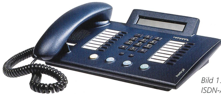
Bild 1. Pronto 32i, das ISDN-Anrufbeantworter-telefon

Das kompakte Multiphone NP75C ist Fax, Kopierer und Telefon in einem. Beim NP85C ist sogar ein Anrufbeantworter integriert. Und all dies auf einer Standfläche, die nicht viel grösser ist als ein A4-Blatt. Dank der Normalpapier-Ausgabe können Kopien und Faxe als Dokumente abgelegt oder weiterverwendet werden. Geschäftliche und private Briefkorrespondenz kann nun per Fax auf schnelle,