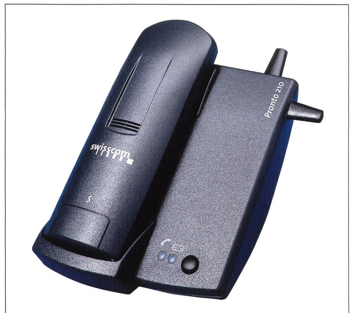
Bild 3. Pronto 210, das ausbaubare Schnurlostelefon.