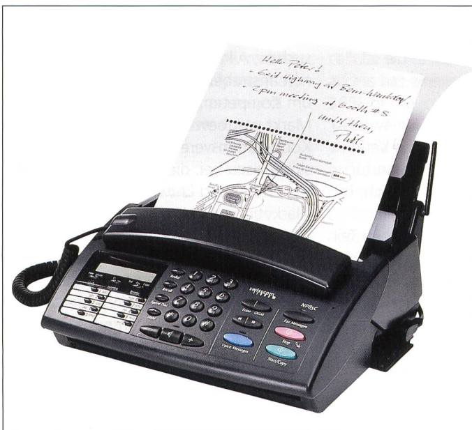
Bild 2. NP75C/NP85C, die kompakten Multiphone.

Mit dem Pronto 32i ist man dank integriertem Anrufbeantworter rund um die