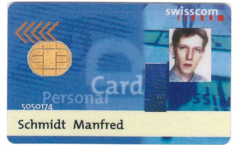
Bild 4. Mögliche Anwendung: Smart Card als Personal Card Swisscom.

vorgelegt [4]. Zwei Jahre danach stellten R.L. Rivest, A. Shamir und L. Adleman einen solchen Algorithmus vor, der nach seinen Erfindern benannt (RSA-Algorithmus) und bis heute das verbreitetste Verfahren dieser Art ist. Dabei verfügt jeder Benutzer über ein Schlüsselpaar, von dem einer, der Public Key, öffentlich bekannt ist – etwa durch Hinterlegung in einem öffentlich lesbaren Verzeichnis –, während der zweite, der Private Key, geheim bleibt. Nachrichten, die mit einem der beiden verschlüsselt worden sind, können nur mit dem passenden Gegenstück entschlüsselt werden. Dieser Ansatz eröffnet die Möglichkeit der eindeutigen Identifikation des Empfängers oder des Absenders einer verschlüsselten Nachricht. Im ersten Fall wird eine Nachricht mit dem Public Key des beabsichtigten Empfängers chiffriert, sodass nur der Besitzer des zugehörigen Private Keys die Nachricht entschlüsseln kann. Diese Funktion entspricht der eines Briefkastens mit Schloss: Jeder kann einen Brief einwerfen, aber nur der Inhaber des Schlüssels kann die Nachrichten lesen. Im zweiten Fall wird die Nachricht mit dem Private Key des Absenders verschlüsselt. Jeder Empfänger kann diese Nachricht mit dem Public Key entschlüsseln und so den Absender identifizieren. Diese Funktion entspricht einem verschlossenen Schaukasten: Jeder kann den Inhalt sehen, aber nur der Eigentü-