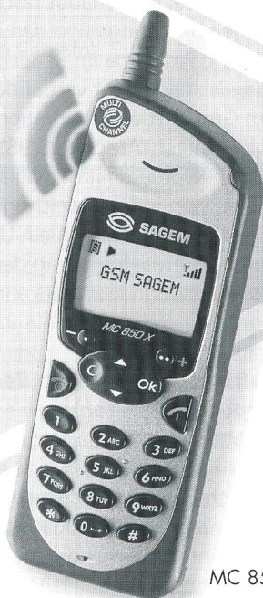
MC 850 X

Speziell für Mithörer! Die Freisprecheinrichtung des Sagem MC 850 erlaubt auf Wunsch das Mithören über einen eingebauten Lautsprecher.