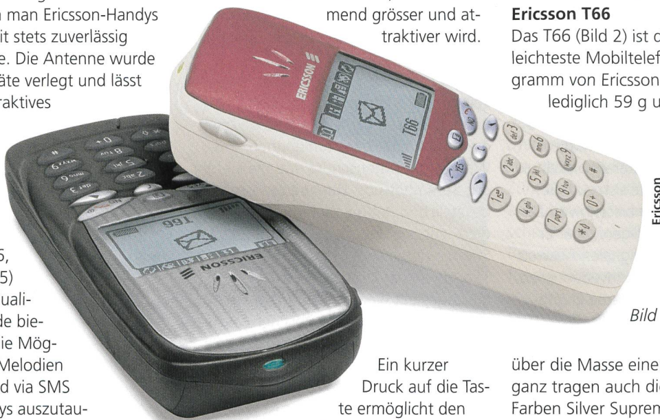
Bild 1. Ericsson T66.

Das T66 (Bild 2) ist das kleinste und leichteste Mobiltelefon im Lieferprogramm von Ericsson. Der Winzling wiegt lediglich 59 g und verfügt damit