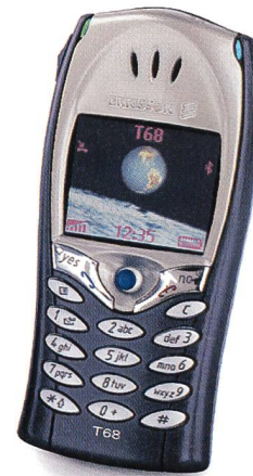
Bild 2. Ericsson-Triple-Band-GSM-Handy T68i mit Bluetooth, GPRS, Wireless Java und MMS.

spektiven von Bluetooth vor Augen zu führen (siehe Kasten).