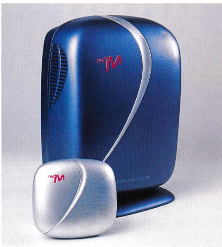
Bild 8. Red-M 3000AS Access Server und 1000AP Access Point.

sungen 103 × 46 × 20 mm deutlich kleiner als das 6310i. Die Hauptanwendung für Bluetooth sieht Nokia wie Mitbewerber Ericsson ebenfalls in der drahtlosen Synchronisierung der persönlichen Agenda mit dem PC im Büro und im drahtlosen Freisprechen beispielsweise im Auto. Darum bietet Nokia als Ergänzung zu seinen Handys das passende Zubehör mit Bluetooth-Technik an, so zum Beispiel eine Freisprecheinrichtung (Bild 6), eine Netzwerkkarte als Einschub in den PC (Bild 7) und einen Bluetooth-Erweiterungskit für das Auto. Unter der Bezeichnung PC Suite 4.52 bietet Nokia für das 8910 zudem ein Softwarepaket an, welche das Management des Handys ab PC erlaubt. Damit lassen sich die Telefoneinstellungen, der Organizer mit allen Terminen und Kontakten oder To-Do-Listen vom PC aus verwalten. Es lassen sich aber auch eigene Logos und Klingeltöne erstellen und auf das 8910 ab dem eigenen PC herunterladen. Die PC Suite 4.52 wird übrigens bei allen 8910 gratis mitgeliefert, sie lässt sich aber auch inklusive neuer Updates von der Homepage: www.nokia.com herunterladen.