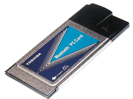
Bild 12. Bluetooth-fähige PCMCIA-Karte von Toshiba zur Erweiterung von PC und Beamer.