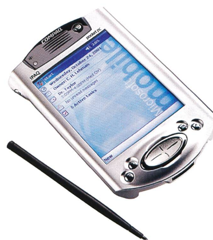
Bild 13. Compaq iPAQ mit Bluetooth-Schnittstelle.

Mit der Toshiba-X-Serie sind auch Präsentationen ohne Notebook möglich. Daten und Bilder können im JPEG-Format auf die PC-Karte gespielt und direkt in den Projektor transferiert werden. Alle angegebenen Preise verstehen sich inkl.