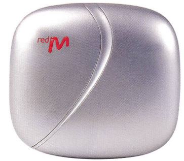
Bild 9. Red-M 1050AP LAN Access Point.

Red-M (Homepage: www.red-m.com ) ist ein führender Anbieter von lokalen Kommunikationslösungen basierend auf Bluetooth. Die Netzbasis dazu liefern die Zugangsserver (Access Server, kurz AS), die an die Zugangspunkte (Access Points, kurz AP) angeschlossen werden. Der Red-M-3000AS stellt das Bluetooth-Basisnetz bereit, an dem eine Anzahl von Endgeräten (PDAs, Laptops, PCs und Handys) angeschlossen werden können. Mit einem oder mehreren Red-M-1000-APs kann das Einzugsgebiet des 3000AS erweitert und damit die Anzahl der an das Bluetooth-Netz angeschlossenen Benutzer erhöht werden, die dadurch eine höhere Mobilität erhalten (siehe dazu auch den Kasten «Bluetooth-Kongress 2002»). Als Stand-alone-Lösung spielt der Red-M-1050AP die Rolle des Einstiegsmodells in das «Bluetooth Networking» für Local Area Networks (LANs) mit einem Versorgungsradius von bis zu 100 m (im Freien). Schliesslich gibt der Red-M-«Blade» den Nutzern eines Palm Vx und eines Handspring Visor die Möglichkeit, sich via Bluetooth mit dem Büro-PC zu verbinden, um persönliche Daten (Termine, E-Mails, neue Dokumentenversionen) mit dem Intranet zu synchronisieren. Distributor von Red-M-Produkten in