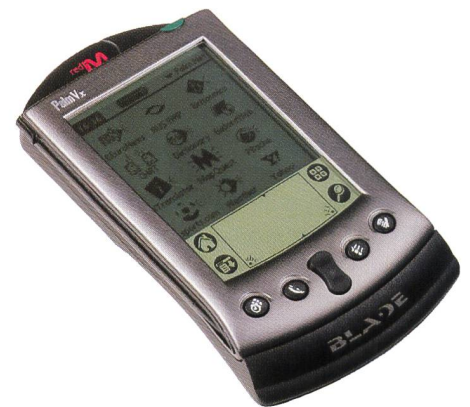
Bild 11. Red-M-Blade für Palm Vx (im Bild hinter dem Palm installiert).