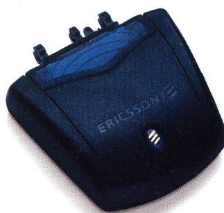
Bild 4. Ericsson-Bluetooth-Adapter DBA-10.

Bluetooth sendet im so genannten ISM-Band (Industrial Scientific and Medical) auf der 2,4-GHz-Frequenz. Dieses Frequenzband ist weltweit lizenzfrei verfügbar, wird allerdings auch von anderen Anwendungen wie den Wireless Local Area Networks (WLANs) verwendet. Bluetooth wurde wegen der potenziellen Gefahr von Störungen robust ausgelegt, so zum Beispiel mit einer speziellen Prozedur für den Frequenzwechsel (Frequency Hopping). Die Datenübertragung erfolgt bei Bluetooth mit Datenpaketen, wobei nach jedem empfangenen oder gesendeten Paket die Frequenz gewechselt wird, um die Wahrscheinlichkeit von Interferenzen zu minimieren. Im Vergleich zu anderen Anwendungen benutzt Bluetooth zudem kleinere Datenpakete und wechselt häufiger die Frequenz, was eine sehr schnelle Acknowledgement-Prozedur zwischen Sender und Empfänger bedingt. Auch für die Sicherheit der Bluetooth-Verbindung ist gesorgt, da alle Bluetooth-Pakete verschlüsselt übertragen werden. Darüber hinaus sorgt eine spezielle Fehlerkorrektur mit verschiedenen Korrekturstufen für eine Kompensation wechselnder Bedingungen im Funkfeld.