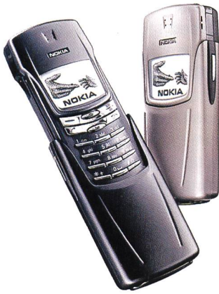
Bild 5. Nokia 8910.