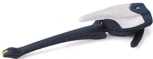
Bild 3. Ericsson-Bluetooth-Headset HBH-15.