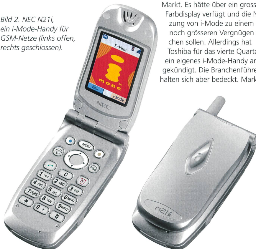
Bild 2. NEC N21i, ein i-Mode-Handy für GSM-Netze (links offen, rechts geschlossen).

Markt. Es hätte über ein grosses Farbdisplay verfügt und die Nutzung von i-Mode zu einem noch grösseren Vergnügen machen sollen. Allerdings hat Toshiba für das vierte Quartal ein eigenes i-Mode-Handy angekündigt. Die Branchenführer halten sich aber bedeckt. Markt-