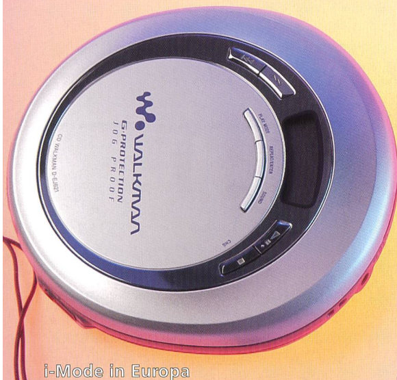
i-Mode in Europa