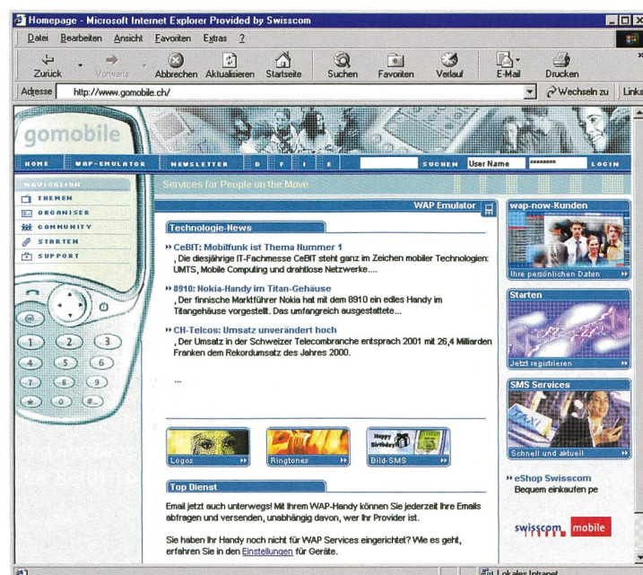
Bild 3. Ein Mobile Portal trägt entscheidend zum Profil eines Mobilfunknetzbetreibers bei.

Grundsätzlich kann man gomobile mit jedem Handy nutzen, da sich die angebotenen SMS Services für alle Handy-Typen eignen. Die Nutzung der WAP-basierten Services bedingt hingegen ein WAP-fähiges Handy. gomobile erfordert ein NATEL-Abo oder NATEL-easy, wobei ein Austausch der bisherigen SIM-Karte nicht nötig ist. Das Portal steht grundsätzlich auch im Ausland zur uneingeschränkten Nutzung über ein mobiles Endgerät bereit. Konkret hängt dies jedoch davon ab, ob Swisscom Mobile im entsprechenden Land einen Roaming-Partner hat, der mobile Datendienste unterstützt. Detaillierte Infos sind unter der Homepage: www.gomobile.com in der Rubrik «Support» beim Punkt «Unterwegs» zu finden. Der private Bereich von gomobile steht allen offen. Wer nicht Kundin oder Kunde von Swiss-