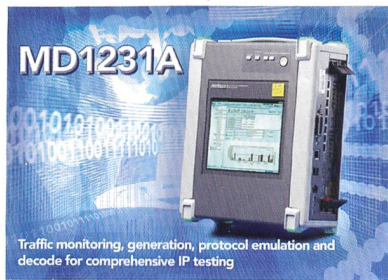
Traffic monitoring, generation, protocol emulation and decode for comprehensive IP testing