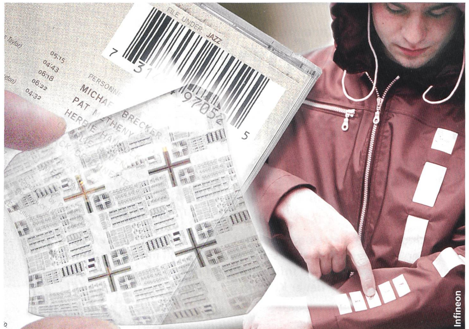
Bild 3. Wenn erst der Anorak dem PC auf dem Schreibtisch mitteilt, dass dessen Besitzer gerade eingetroffen ist und der PC bitte «gebootet» werden soll, dann sind wir endgültig im «autonomen Computing» gelandet.

tive und benutzerspezifische Bedienkonzepte, für die Informationssicherheit und die Erhöhung der Energieeffizienz der im Dauerbetrieb befindlichen Computer (um nur einige zu nennen).