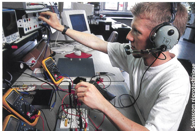
Bild 3. Das Wissen ist in den Köpfen der Menschen; gehen diese weg, verlässt häufig auch das Know-how den Betrieb.