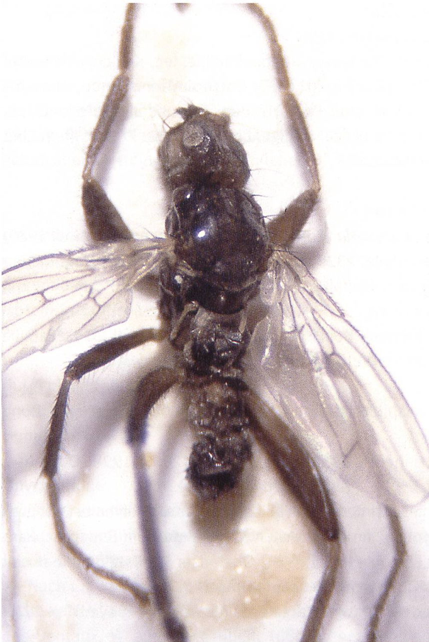
Abb. 2. Crumomyia microps : Paratypus. Obstans. Mikrofoto Kofler.

troglophil (höhlenliebend): C. cavernicola oculea ROHÁČEK & PAPP, C. parentela alpicola (ROHÁČEK), C. setitibialis (SPULER)