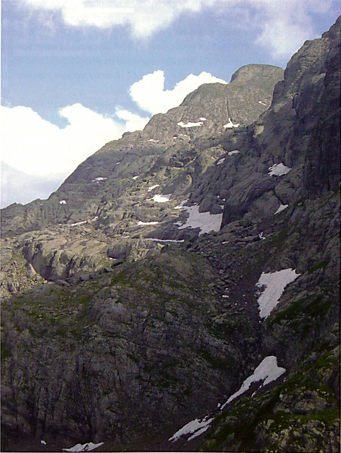
Abb. 3: Der Nordost-Abfall des Massivs vom Pizzo dei Tre Signori ins Valle dell'Inferno: Typenfundort von Oreonebria soror tresignore ssp. nov. Foto: A. Szallies, Juli 2013.

Das Pronotum ist sowohl bei O. soror stat. nov. (Daniel 1903, Ledoux & Roux 2005) als auch bei O. soror tresignore ssp. nov. in der Regel schmäler als bei O. angustata . Die Breiten des Pronotums beider Arten können sich jedoch angleichen, da es – allerdings selten – Exemplare von O. angustata mit schmalerem Pronotum gibt, die ein Breiten-/Längenverhältnis von 1,25 erreichen.