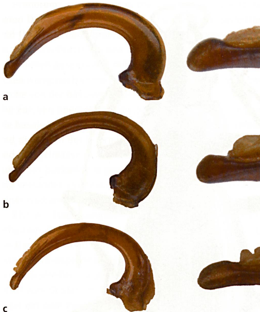
Abb. 2: Aedoeagi (a) Oreonebria angustata (DEJEAN, 1831) (b) O. soror (DANIEL, 1903) stat. nov. (c) O. soror tresignore ssp. nov.

Lateralansichten. Links jeweils Medianlobus in Totalansicht, rechts die vergrößerten Spitzen. Länge der Aedoeagi 1,5 mm; Ausschnitt der Spitzenlängen 0,2 mm.