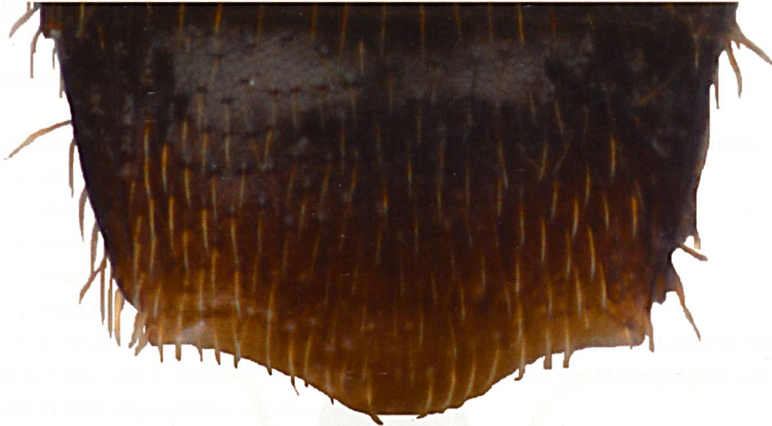
Abb. 2: Leptusa calancensis sp. nov. Tergit des fünften sichtbaren Abdominalsegments (Segment VII) beim ♀. Apikale Breite 0,45 mm.

Paratypen: 10 ♂, 15 ♀, gleiche Funddaten wie Holotypus. 1 ♂ GR Calanca Cauco, Piz de Groven 2500–2600 m, 11.7.2013, leg. Szallies. 1 ♂ GR San Vittore, Pizzo Claro 2500–2600 m, 21.9.2013, leg. Szallies. 2 ♂, 2 ♀ GR Rossa, Cima di Nomnom, Nordgrat 2500–2600 m, 22.9.2013, leg. Szallies. 4 ♀ GR Mesocco, Pian Grand gegen Cima Bedoleta 2400 m, 25.9.2013, leg. Szallies. 2 ♀ GR Mesocco, Pass w. Alta Burasca 2500 m, 25.9.2013, leg. Szallies.