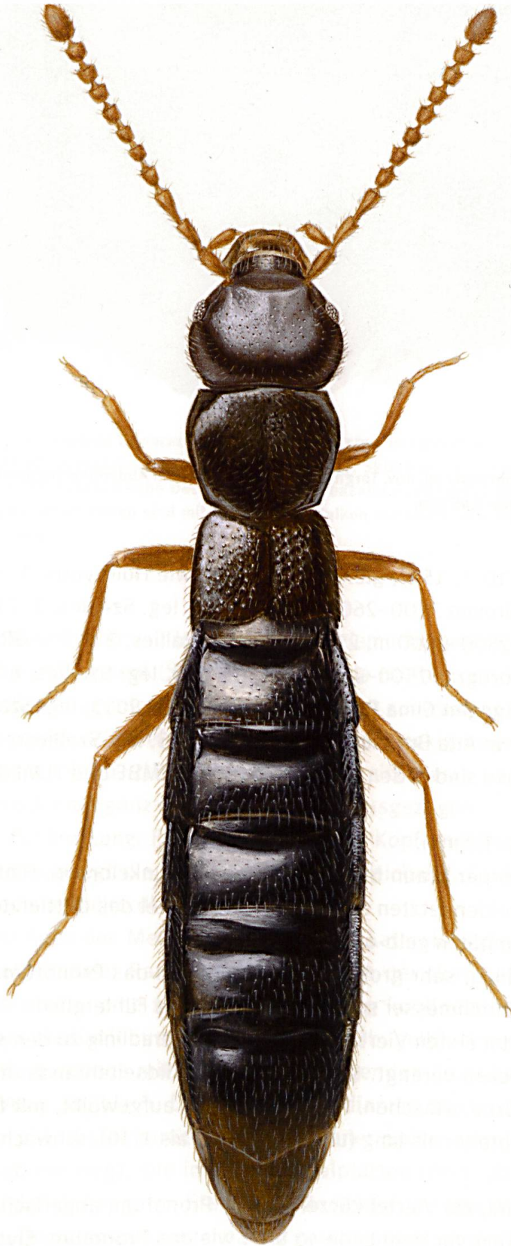
Abb. 1: Leptusa (Ectinopisalia) calancensis sp. nov., Paratypus ♀ (Pizzo del Ramulazz), Habitus dorsal. Körperlänge 3 mm. Zeichnung: Peter Schüle.