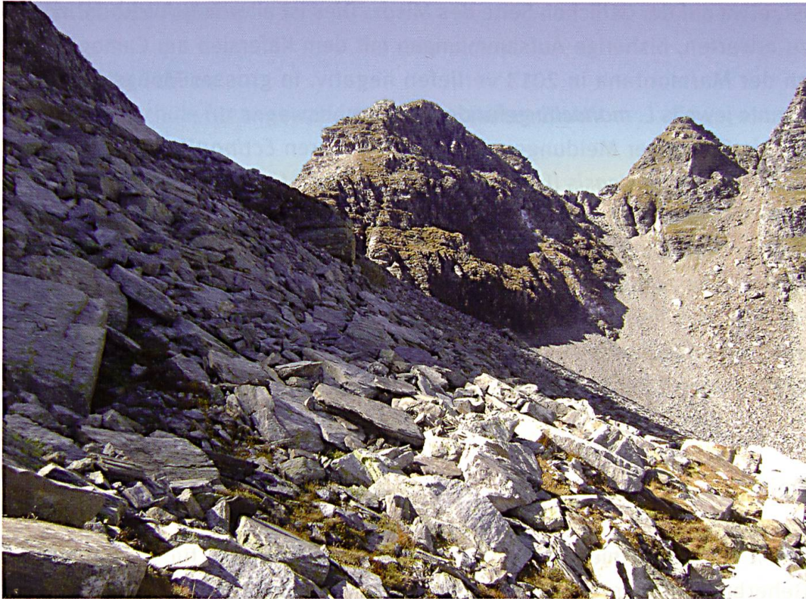
Abb 4: Habitataspekt des ergiebigsten Fundorts von Leptusa calancensis sp. nov., Nordseite des Pizzo del Ramulazz, Blick in Richtung Passo del Ramulazz (linkes Bilddrittel, Pass nicht zu sehen). Leptusa calancensis sp. nov. lebt hier in den Rasenfragmenten auf Blockschutt. Foto: A. Szallies, September 2013.