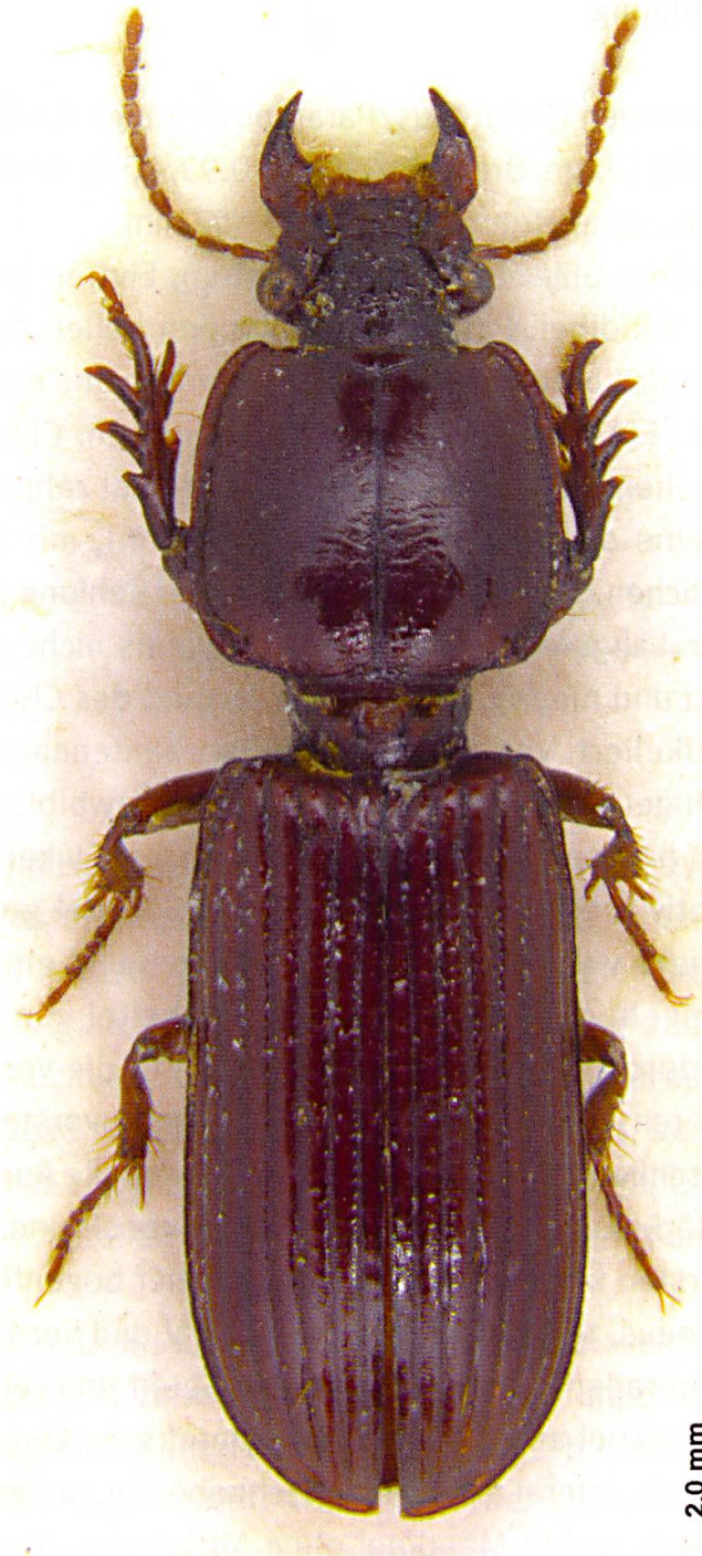
Abb. 1: Rugilucivina promineoculata sp. nov., Paratypus, Habitus. Länge 9,1 mm.