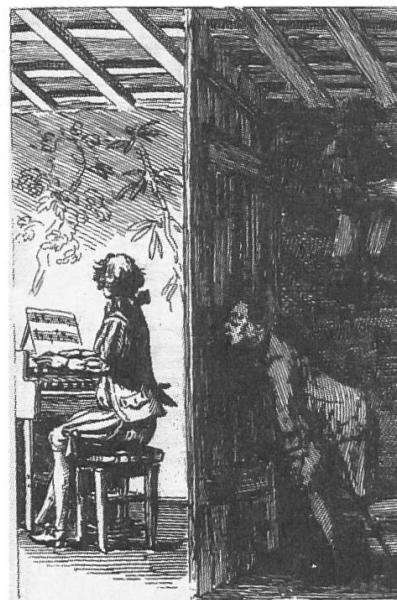
Illustration pour Le Diable amoureux Édition originale, Paris, Le Jay, 1772

Cette qualité de regard se retrouve presque naturellement dans l'utilisation généralisée de l'oxymore dont on a pu voir qu'il constituait l'un des procédés médiateurs les plus puissants du fantastique. Le décor privilégié du conte traduit visuellement la conjonction de ces forces contraires élémentaires que sont la lumière et les ténèbres. Des Nachtstücke de Hoffmann à Saint-Judas-de-la-Nuit de Jean Ray en passant par Gaspard de la Nuit , Nocturnal de Franz Hellens ou même les Poèmes nocturnes , titre que Baudelaire envisagea un instant de donner à son Spleen de Paris , 45 les jeux du clair-obscur conviennent aussi bien au poème en prose qu'au conte fantastique. Or s'il en va de la sorte, c'est bien parce que l'œuvre s'inscrit dans une tradition picturale qui se plaît à