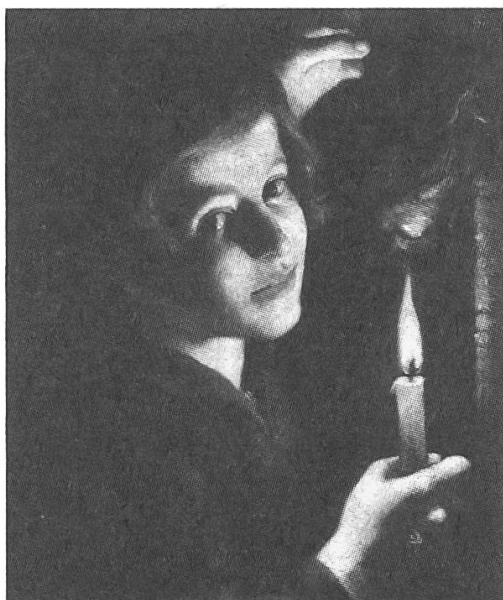
Trophime Bigot Garçon brûlant les ailes d'une chauve-souris, vers 1635, huile sur toile, 45 x 39 cm Rome, Galleria Doria-Pamphili

la lumière – φως – en passant par telle ou telle surface, tel ou tel corps dia-phanes .