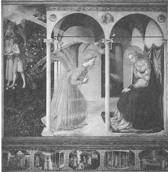
Fra Angelico L'Annonciation, 1430-32 Tempera sur bois, 154 x 194 cm Madrid, Musée du Prado