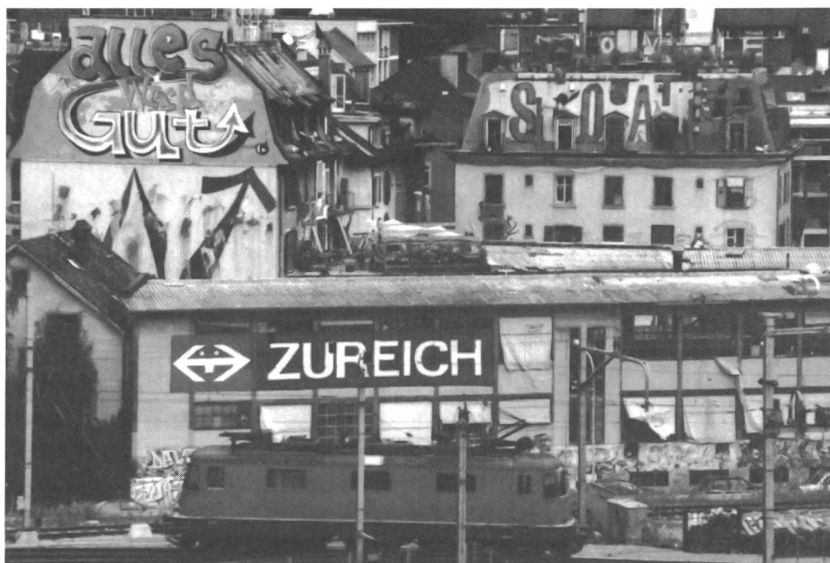
Wohlgroth-Areal, Zürich. Zwischengenutzt 18.5.91 - 23.11.93.

Trotz eines integrativ- undogmatischen Ansatzes, der sich auf ein entwicklungs-offenes Vorgehen ausrichtet, strebt KraftWerk 1 dabei die dauerhafte Übernahme des brachliegenden Bodens an, eine langfristige Neustrukturierung. KraftWerk stösst also zwar in eine Nische vor, möchte sie aber endgültig benisten - nicht als Zugvogel. Aus der Brache würde so wieder ein Stück stabiles Stadt- und Wirtschaftsgewebe. Solch endgültiges Neufüllen der Leerräume zielt also auf einen verbesserten, aber wiederum statisch geplanten Zustand der Stadt.