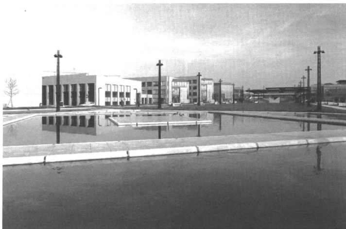
Parc scientifique et technologique, Lausanne (EDPL)

nopolitaine de référence et que ce constat explique en partie les échecs: la région urbaine logeait déjà dans la plupart des cas des germes technopolitains préexistants qui n'ont pas été intégrés aux programmes des projets.