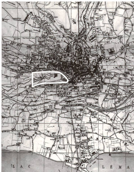
Fig. 1: Le projet visionnaire de 1888.