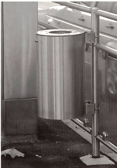
Die Oberflächen und Beschläge wurden optimiert, der Abfallbehälter konnte ästhetisch und funktional verbessert werden.

Les exemples bâlois montrent que des communes et des villes moins importantes ont aussi intérêt à discuter avec les usagers, les architectes et la commission consultative locale