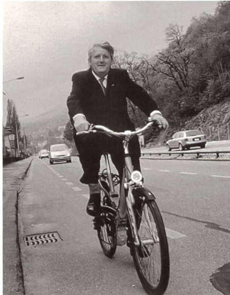
Hans Stöckli dürfte im Expo-Jahr der bekannteste Stadtpräsident der Schweiz werden

Hans Stöckli: Um Erfolg zu haben, genügt es nicht, als Stadtpräsident dynamisch und medienwirksam zu sein. Hinter der heutigen positiven Bilanz liegt ein systematisches Vorgehen. Die Behörden einer Stadt dürfen nicht auf die Investoren warten. Sie müssen die Entwicklung aktiv fördern. Sie müssen unternehmerisch denken, eine regelrechte Promotorenrolle wahrnehmen und sich dazu die nötigen Mittel geben. Im Falle von Biel wurde diese Grundhaltung folgendermassen umgesetzt: