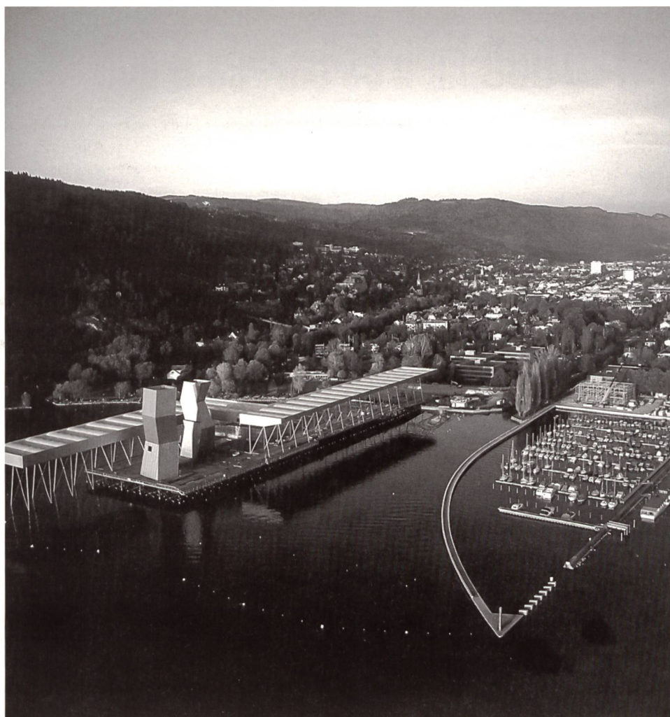
Arteplage Biel mit dem neuen Kleinboothafen

Point de départ de l'entretien: la liaison de la ville avec le lac, conséquence à long terme de l'Expo 02 et résultat le plus manifeste du développement urbain de Bienne. Les terrains importants qui se trouvent au sud de la gare appartiennent désormais à la commune. M. Stöckli met en évidence le lien entre la réussite de la gestion de site et une politique de développement urbain à long terme: elle comprend l'ensemble du territoire de la commune et ne se limite pas au simple aménagement, mais intègre dans sa problématique les aspects sociaux, économiques et financiers. Sur le plan de l'aménagement du territoire, M. Stöckli souligne l'importance d'une collaboration étroite avec des experts qualifiés.