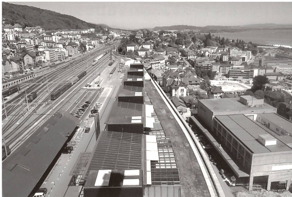
Vue du quartier depuis la tour de l'OFS, actuellement en construction

Ein zentrales Handlungsfeld besteht in der Vernetzung der verschiedenen Partner im betroffenen Gebiet durch ein eigentliches «Coaching»: es umfasst den Ausbau der Beziehungen unter den Grundeigentümern, die Entwicklung von Gesamtkonzepten und das Projektmarketing durch Kommunikationsarbeit und Investorensuche. Das Projekt hat so nicht nur des Entwicklungspotential des Gebiets aufgezeigt, sondern als sein Katalysator gewirkt, indem ein gemeinsames Ziel für alle Partnern formuliert wurde. Der Wille zur Innovation und der Grundsatz einer nachhaltigen Entwicklung haben dem Prozess eine zusätzliche Sichtbarkeit gegeben. Solche über die übliche städtebauliche und architektonische Planung hinausgehende Leistungen scheinen bei Projekten einer gewissen Größe, die eine bedeutende Zahl von Akteuren einbeziehen, angebracht. Sie werden insbesondere durch die spezifische Komplexität einer Operation diktiert und sollten bei der Formulierung von öffentlichen und privaten Aufträgen verstärkt berücksichtigt werden.